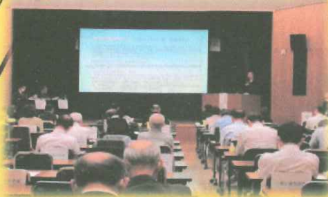
ワークショップひょうご2022

主催 独立行政法人 高齢・障害・求職者雇用支援機構 兵庫支部 共催 兵庫労働局・ハローワーク / 兵庫県 後援 神戸新聞社